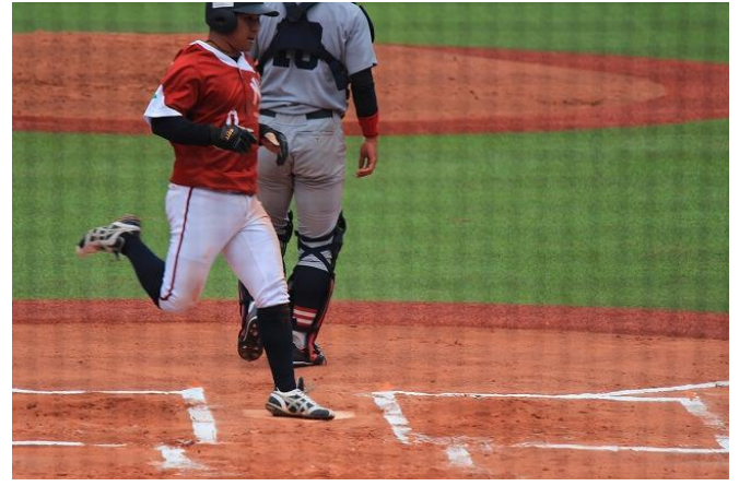
1塁から一挙4点目ホームイン