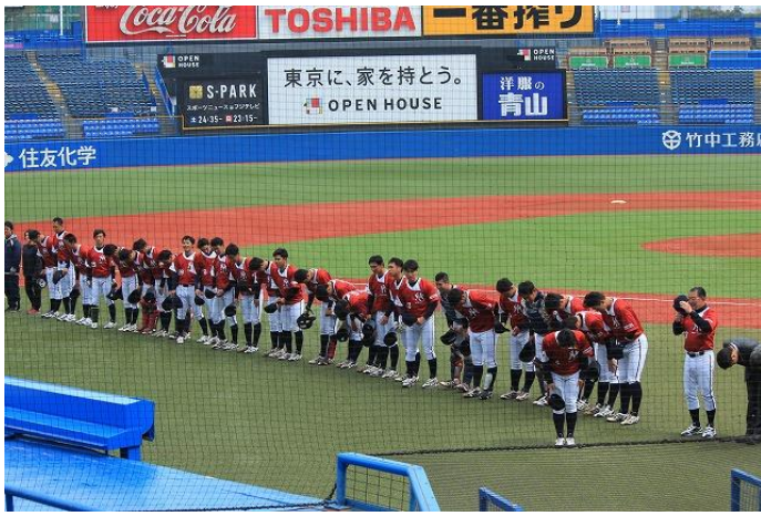
試合前 応援団に挨拶