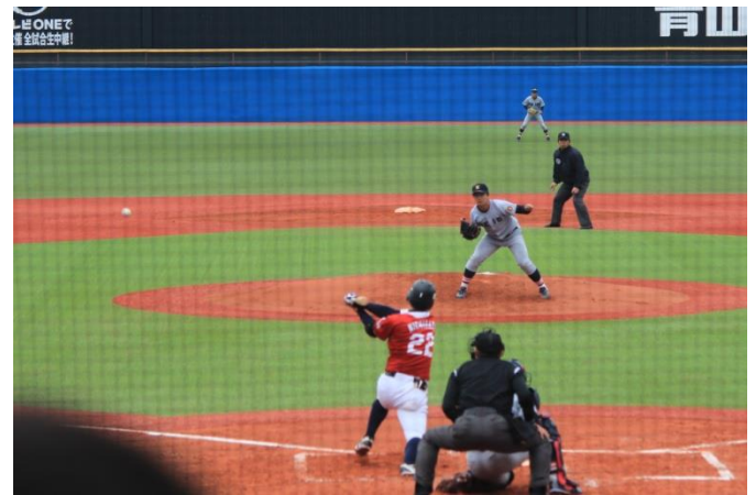
2回道端選手レフト前にタイムー